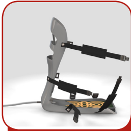
C-BOOT Tratamiento del Pie Diabético Ref. 5350046

PATENTADO: Único accesorio del mercado para el tratamiento de la Tecarterapia en patologías vasculares.